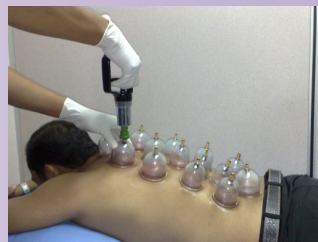
Bekam mengikut titik-titik Akupunktur

Kami turut menyediakan perkhidmatan pemeriksaan tekanan darah, pemeriksaan glukos dalam darah, pemeriksaan ujian darah (Full-blood test), sauna herba dan sauna infrared.