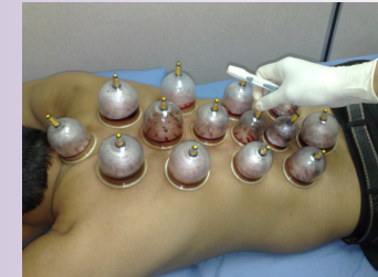
Bekam untuk merawat organ dalaman